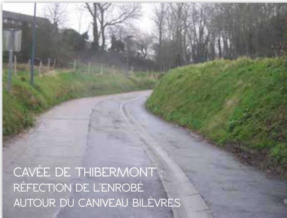
CAVÉE DE THIBERMONT : RÉFECTION DE L'ENROBÉ AUTOUR DU CANIVEAU BILÈVRES

Dans le cadre des économies d'énergie, la municipalité a souhaité installer des leds pour l'éclairage du parking et prévu des détecteurs de présence afin d'éviter une utilisation constante qui ne se justifie pas dans un tel lieu. Le gain des économies ainsi réalisées est de l'ordre de 35 %.