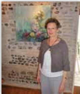
EXPOSITION DE PEINTURE MARTINE MORISSE