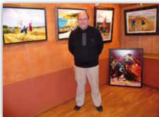
EXPOSITION DE PEINTURE « CHARLES »