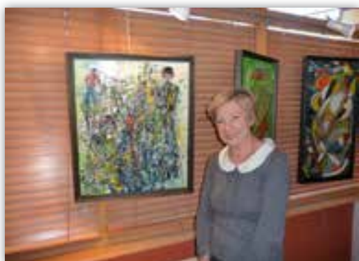
EXPOSITION DE PEINTURE NIKOLE CRAMPON-DROUIN