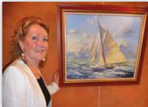
EXPOSITION DE PEINTURE SABINE PERRIN DE ROCQUIGNY