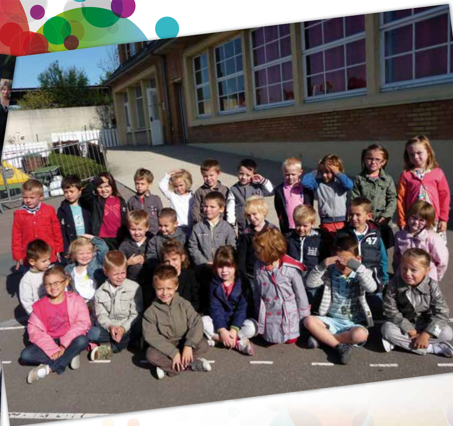
L'effectif de l'école maternelle « Les Farfadets » est de 58 enfants répartis dans les classes de Mme Reine-Blaizel et de Mme Toussaint : 23 petits, 15 moyens et 20 grands.