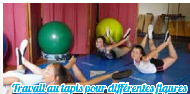
Travail au tapis pour différentes figures d'acrobatie ou d'équilibre, ...

Venez donc jongler, vous initier à l'Acrobatie, apprendre l'Équilibre, monter sur un Trapèze. Tout est possible à l'Arche de Noë dans un milieu très sécurisé car en intérieur.