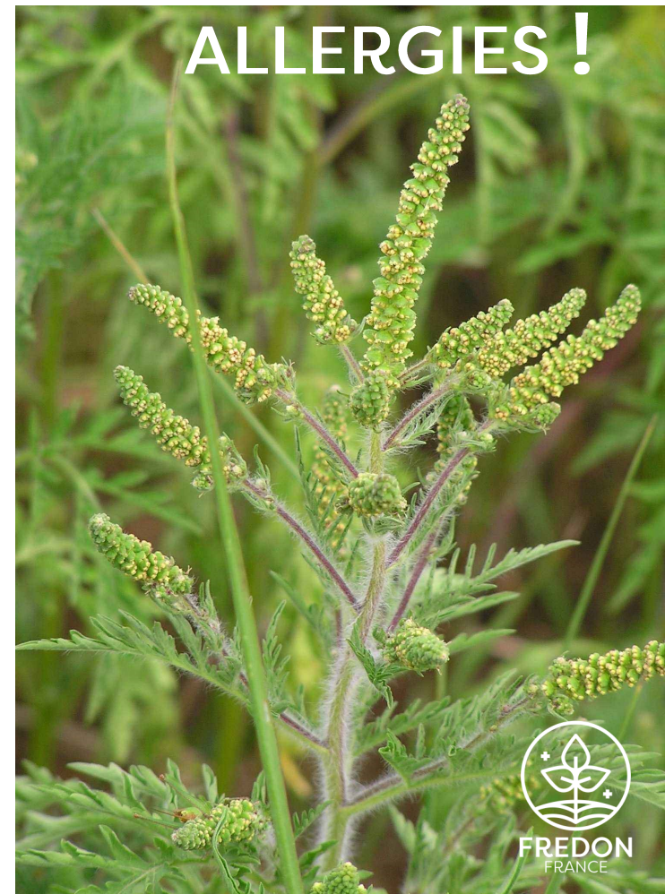
AMBROISIE À FEUILLES D'ARMOISE